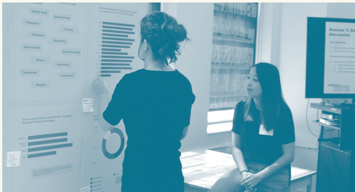
Workshop del proyecto, Nueva York, mayo de 2018, Parsons DESIS Lab.