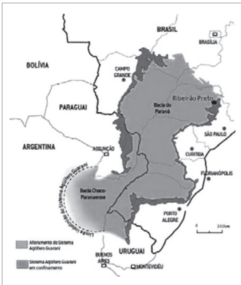
Figura Nº 1 Sistema Aquífero Guarani

Esse município ocupa uma área de 650 km 2 e se localiza na região nordeste do Estado de São Paulo a 313 km da capital São Paulo (Figura Nº 1). A população é de aproximadamente de 550.000 habitantes e a economia está focada no setor de serviços. Diante de sua localização privilegiada em relação a importantes centros consumidores