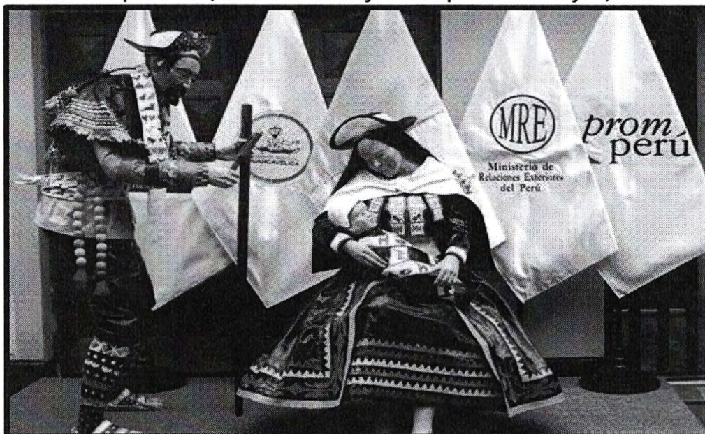
Imagen N° 06 La sagrada familia fue bendecida antes de su exposición en la Santa Sede del Vaticano por el Nuncio Apostólico, Nicola Girasoli y el Obispo de Carabayllo, Lino Panizza.