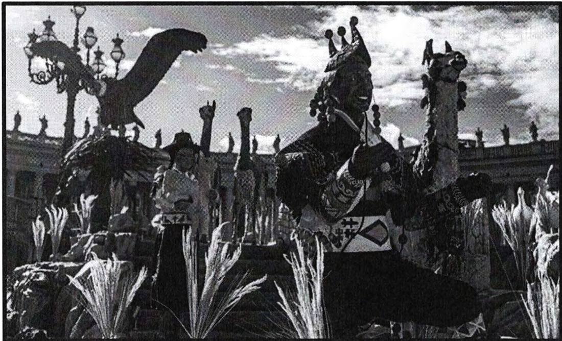
Imagen N°09 Rey mago y pastora de la gran “Nación Chopcca”