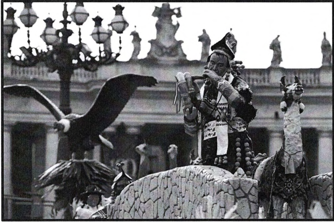
Imagen N° 08 Rey mago Chopcca con su “wajrapuco”