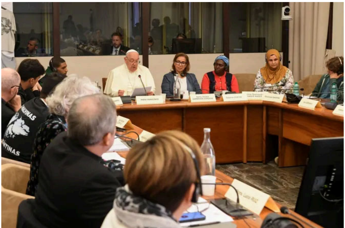
El Papa Francisco lee su discurso durante la reunión de Encuentros Populares en Roma