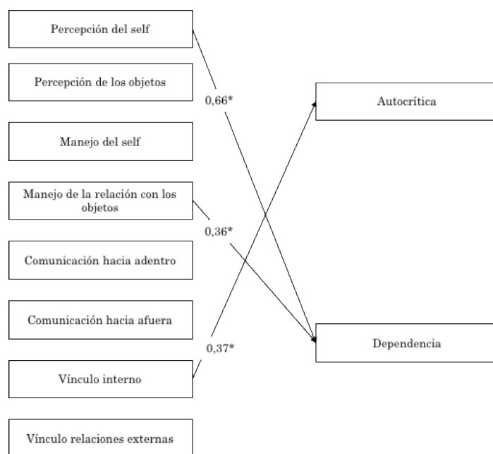
Figura 2. Relación entre vulnerabilidades del funcionamiento estructural y estilos depresivos. * p < 0,05 .

Al ingresar la dependencia y la autocrítica como predictores tanto del intercepto como de la pendiente, se observa que ambos se asocian con el intercepto, pero solo la dependencia se asocia con la pendiente. Dicho de otro modo, tanto la dependencia como la autocrítica se asocian directamente con el bienestar general inicial, lo que implica que mayores puntajes en estas escalas están relacionados con un menor bienestar general. Sin embargo, solo la dependencia se asocia con los resultados terapéuticos en el transcurso del proceso. Esta asociación es inversa, de manera que una mayor dependencia se asocia a una mayor tasa de cambio.